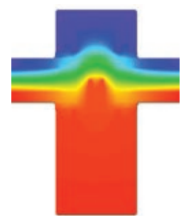
Termisk snit. Mindste varmetab indikeres med rød farve.