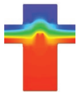
Termisk snit. Mindste varmetab indikeres med rød farve.